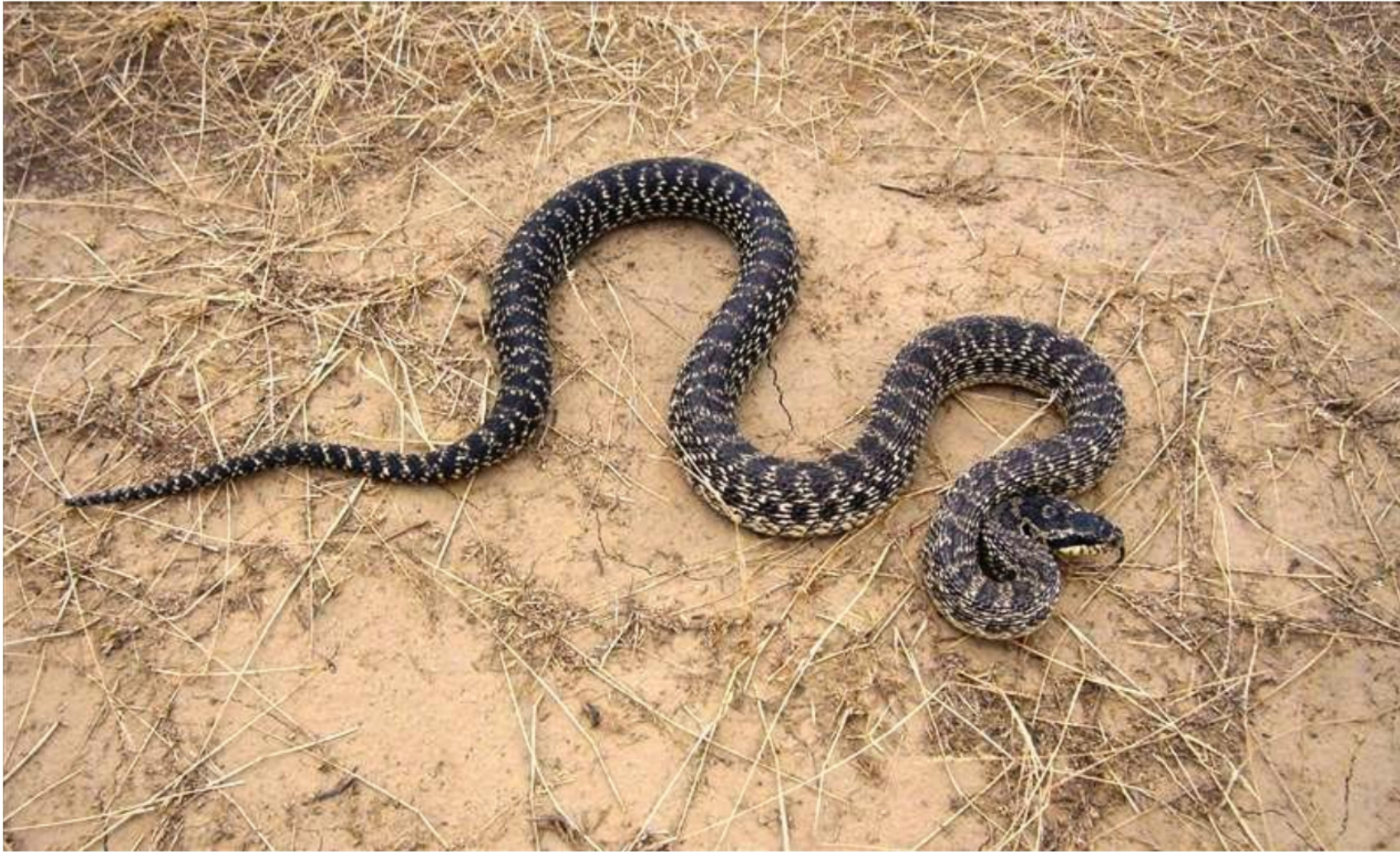
Сарматский полоз. Полоз сарматский четырёхполосный - редкое краснокнижное животное Крыма.