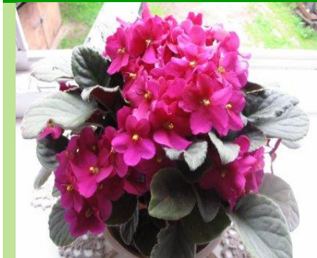
Фиалки с разной окраской цветков.