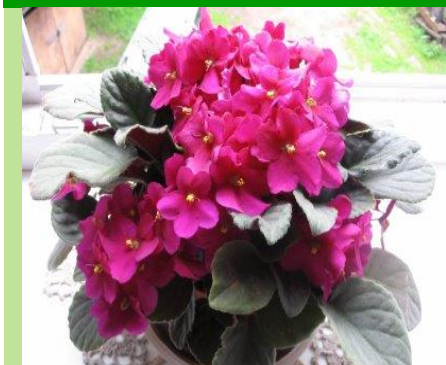
Фиалки с разной окраской цветков.