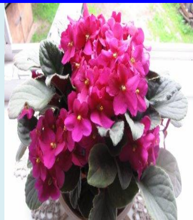
Фиалки с разной окраской цветков.