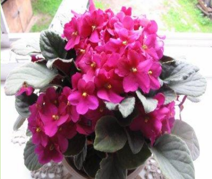
Фиалки с разной окраской цветков.